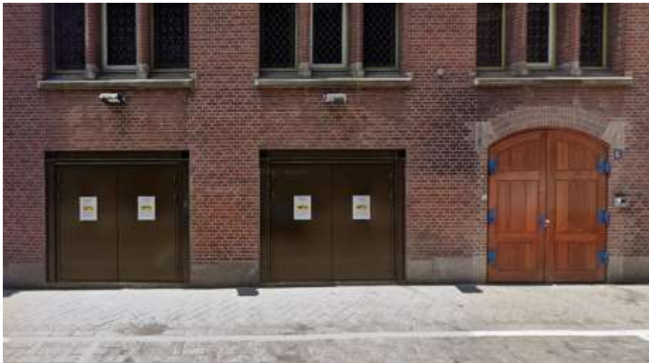
Beursstraat 6: Expeditie