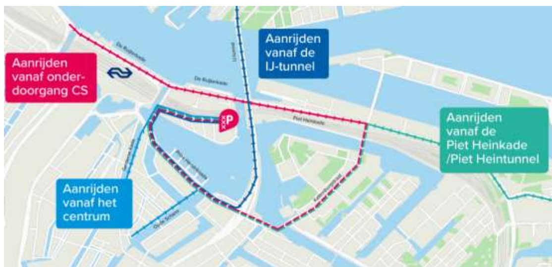
Aanrijroute - Parking Centrum Oosterdok

Een parkeerplek reserveren kan via de website: https://parkingcentrumoosterdok.nl/reserveren/